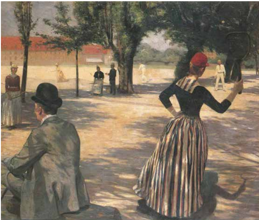
Maleri af N.V. Dorph 1890: Lawn-tennis på Eksercerpladsen.

don. Hvis vi så en video med deres spil i dag, ville det sikkert virke temmelig langsomt og adstadigt. I løbet af 1970'erne skiftede spillet nemlig i nogen grad karakter, idet fremkomsten af lettere og 1-3 tommer bredere ketsjere kom til at betyde en væsentlig ændring i spilleteknikken, så bolden opnåede 4-5 gange så meget spin som før. Tennis er dermed blevet et hurtigere og mere kraftfuldt spil. Denne udvikling har