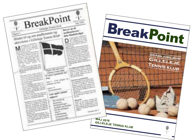
Forside af det første og det seneste nummer af BreakPoint .