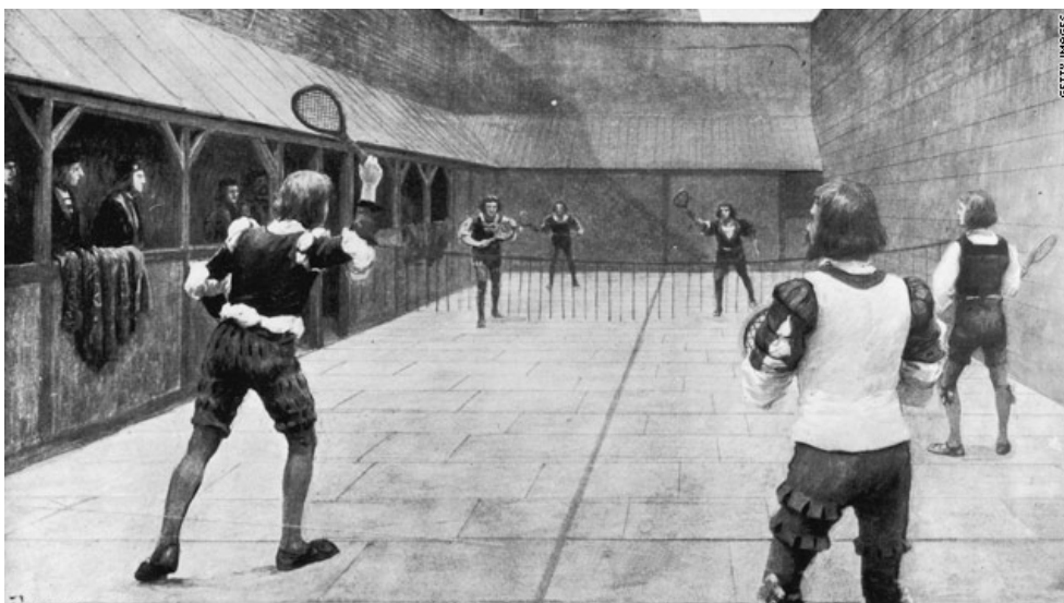
Tennis i England under Henrik VIII.

Efter den franske revolution i 1789 mistede spillet tilhængere. Først i midten af 1800-tallet blev moderne tennis taget op i England – på samme tidspunkt kom også bolden af gummi til – men først i den sidste del af århundredet blev spillet igen rigtigt populært, nu udenørs og på græs under navnet lawn tennis . Især var de velplejede engelske krocketplæner gode at spille på. Sjovt nok er reglerne i moderne tennis stort set uændrede siden slutningen af 1800-tallet, når der ses bort fra reglen om tie break, som blev indført i 1970'erne.